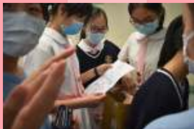
同學都對貼紙的設計很有興趣