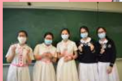
一起為期終試加油!