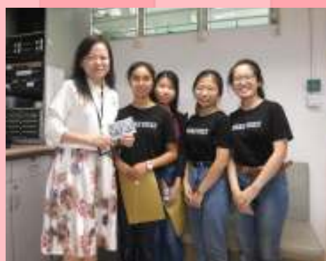
感謝校長慷慨捐款

每逢世界視覺日，奧比斯均會舉行襟章義賣，而本年度則定於10月10日。在一眾同學、老師，以至校長的支持下，我們共籌得約一萬五千元，並捐出用以優化眼科手術器材。