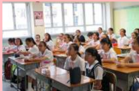
同學很專心聆聽介紹呢!