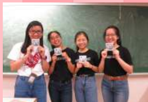
「救盲物資·因你不缺」— “Every Badge Saves Sight”

考試將至，我們設計了多款貼紙籌款，希望鼓勵同學，同時為奧比斯募捐。籌得款項扣除成本已全數捐予奧比斯，資助更多盲疾患者接受眼科治療。