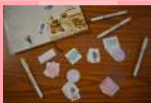
貼紙寫上鼓勵及救盲相關字句