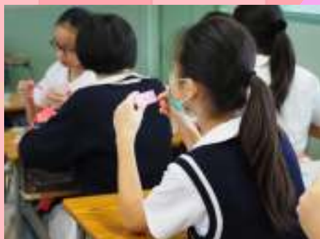
同學從遊戲認識奧比斯

為加深中一同學對奧比斯救盲工作的認識，我們於9月27日舉行了早會活動。活動內容包括影片播放、遊戲及問答環節。同學都投入於活動中，對奧比斯的救盲工作十分感興趣。