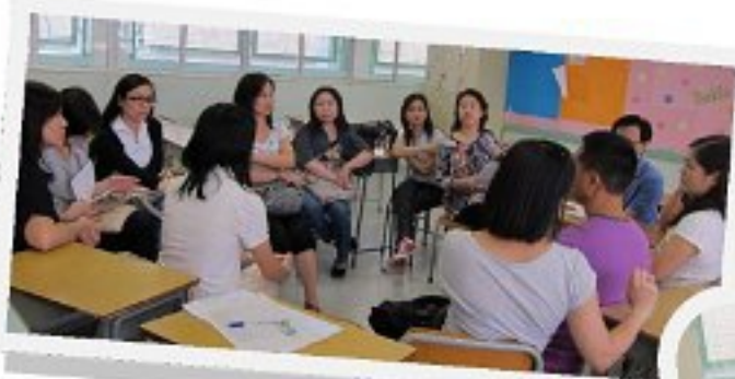
家長與班主任/科任老師會面

會後，設有家長與班主任或科任老師會面的時段，家長們把握這機會了解女兒在學校的情況。