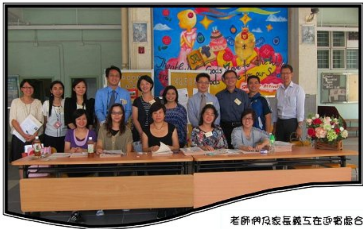
老師們及家長親互在迎賓處合照

家長教師會週年大會已於 10 月 6 日舉行，共有 130 多位家長及老師出席。