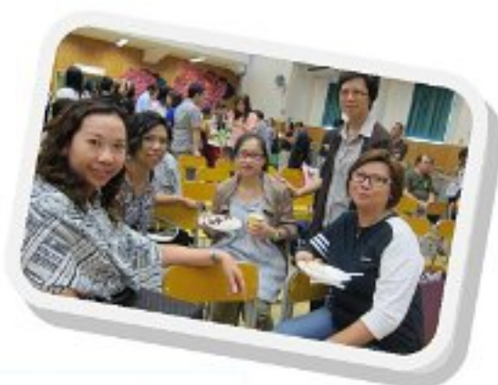
小休時啜茶點招待

會後，設有家長與班主任或科任老師會面的時段，家長們把握這機會了解女兒在學校的情況。