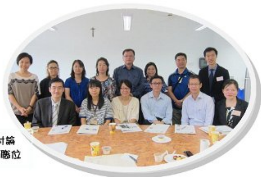
新一屆委員隨即開會討論 來年工作，並推選負責職位