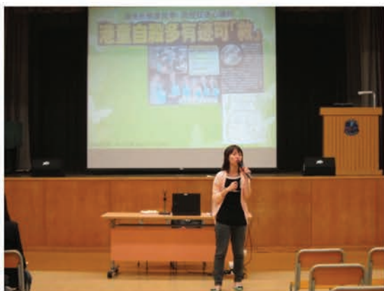
「生命熱線」的社工與各家長 分享辨識青少年行為的方法

於大會當天，本會邀請「生命熱線」機構為家長講解青少年抑鬱、情緒困擾及自毀行為的辨識，以達致「及早識別、介入及轉介」，預防青少年自傷或自殺行為。在青少年的成長過程中，家庭關係佔一重要地位，尤其有抑鬱情緒或患有抑鬱症的青少年，家人的明白、包容及支持都能有效地陪伴他們過渡艱困的成長歲月。