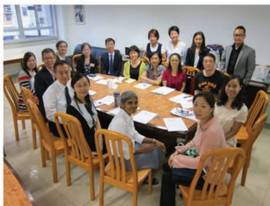
新一屆執委的第一次會議