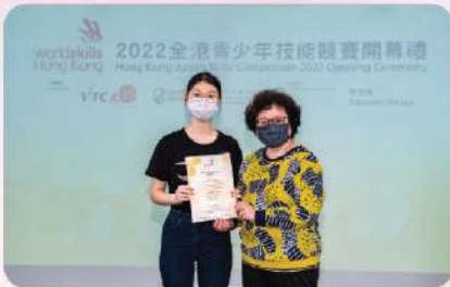
▲ 數碼化建設比賽高中組季軍