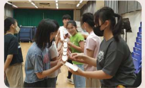
▲ 合作運球考驗默契