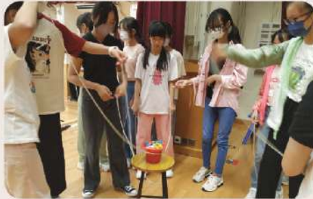
▲ 齊心協力完成任務