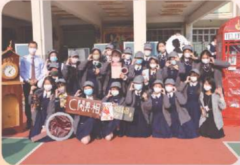
最佳裝飾攤位得獎班別