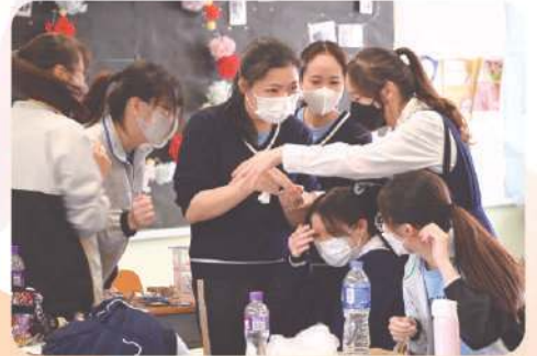
為遊藝日做好準備