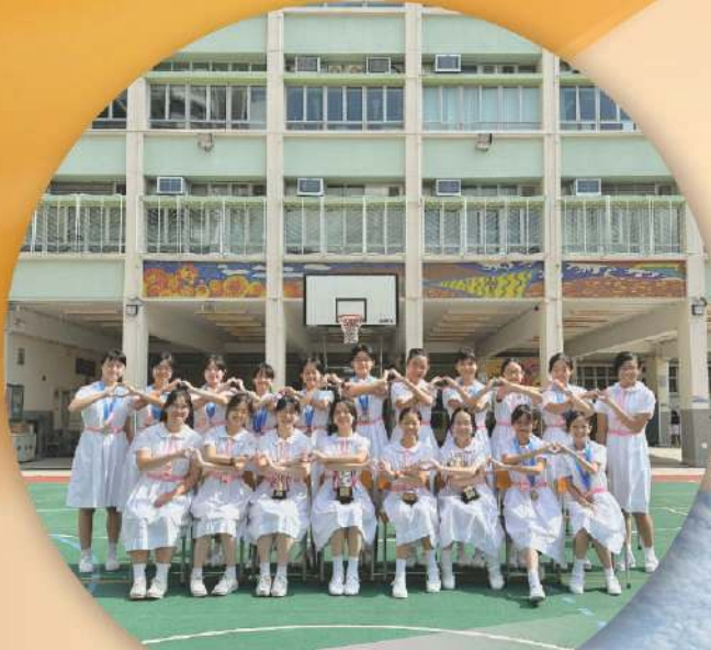
2023-24年度 沙西區中學校際游泳比賽 女子組全場第五名