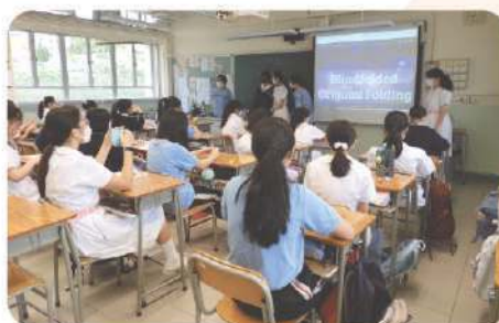
▲ 奧比斯學生大使們為中一新生介紹奧比斯的工作