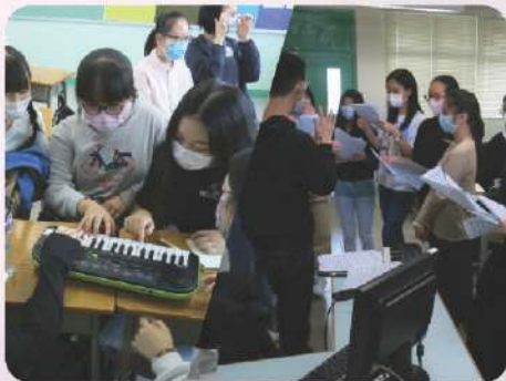
無伴奏合唱工作坊及訓練體驗