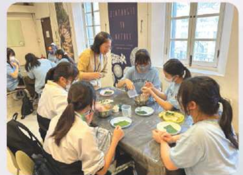
綠匯學苑 慧食工作坊