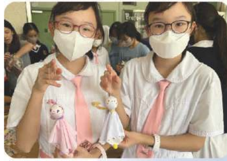
晴天娃娃製作工作坊