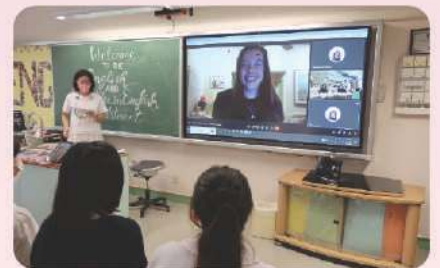
▲ 中四同學主動聯絡美國小說作家, 並舉辦網上研討會