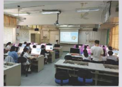
▲ Swift 編碼工作坊