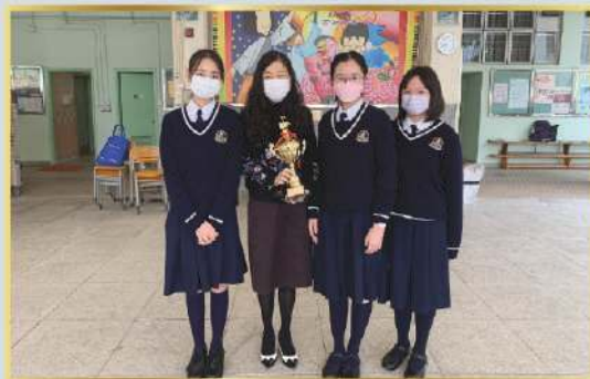
2022 香港青年音樂匯演 中樂團 銅獎