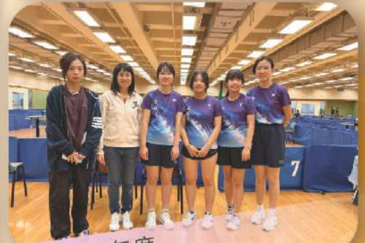
2023-24年度 香港學界體育聯會 沙田及西貢區中學校際乒乓球比賽 女子甲組亞軍