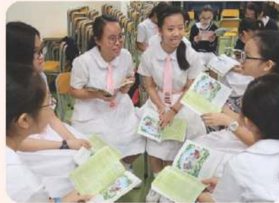
▲ 校內中英文閱讀大使計劃