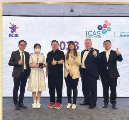
於國際聯校學科評估及比賽(ICAS) 之英語寫作比賽中榮獲 Top Medal Winner