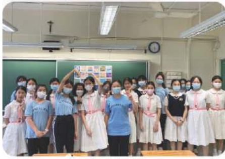
和諧粉彩畫興趣班