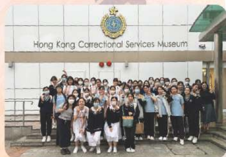
參觀香港懲教博物館