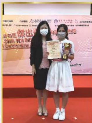
沙田區傑出學生一高中組