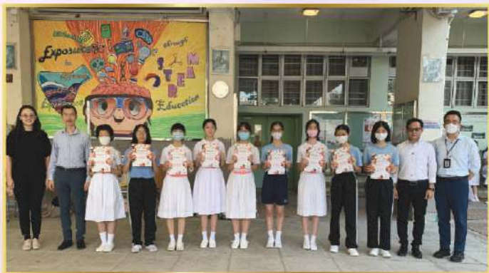
「傳承·想創—積極推廣中國歷史與中華文化學校年度大獎」 嘉許獎 (2022-2023) 積極學習中國歷史與中華文化獎