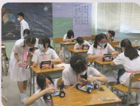
親手製作太陽能車