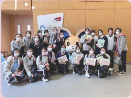
參觀中華電力低碳能源教育中心