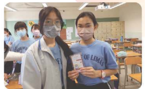
▲ 同學們積極參與奧比斯義賣活動