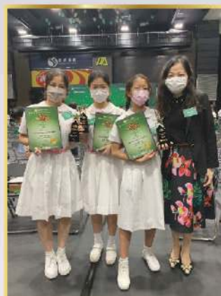
香港傑出少年選舉