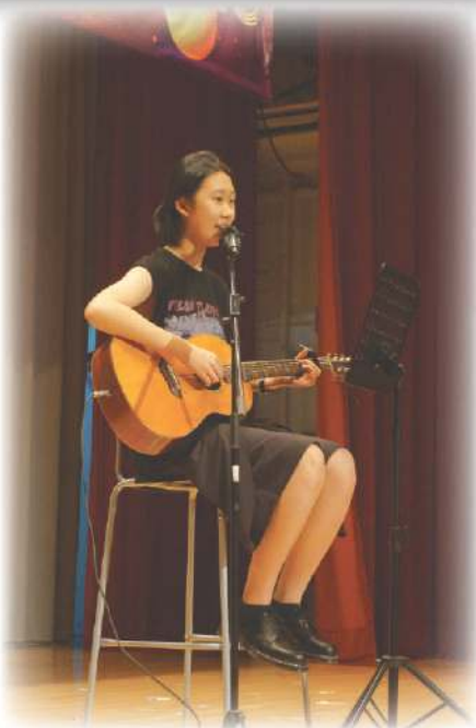
▲ 我們的學生在奧比斯聯校音樂會義演，為奧比斯籌款