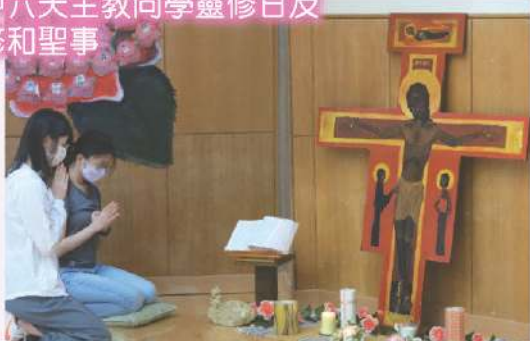
中六天主教同學靈修日及 修和聖事