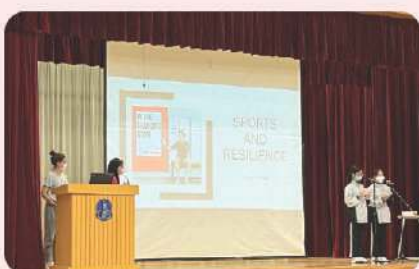
▲ 中四同學參加由香港國際文學節舉辦主題為運動與堅持的講座