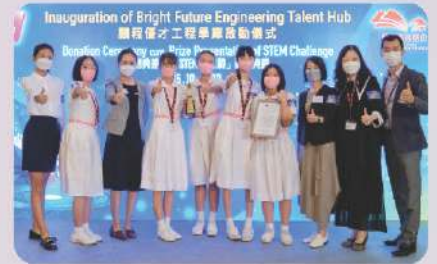
▲ 最佳三支隊伍之一