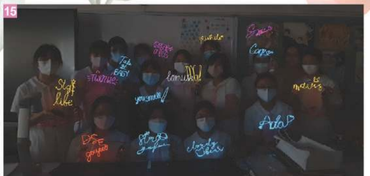
14 視覺藝術科課堂創作活動 15 霓虹燈藝術工作坊