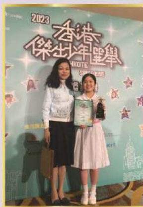
2022-2023 香港傑出少年選舉 (個人奮進組)