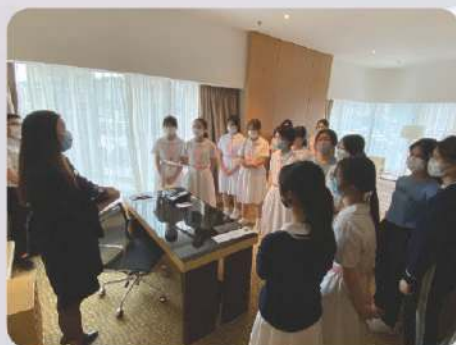
參觀沙田萬怡酒店