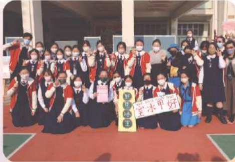
最佳遊戲設計攤位得獎班別