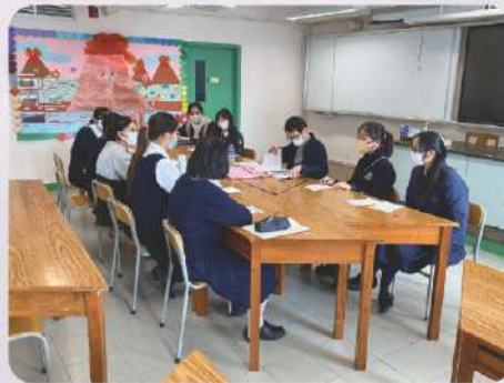
中六模擬大學面試工作坊