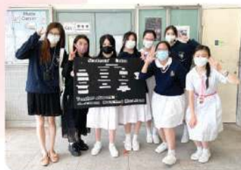
學生會與顧問老師合照