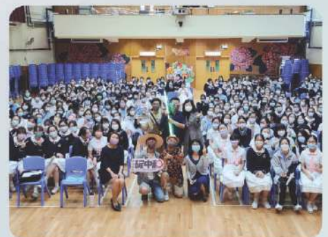
體驗互動劇場活動