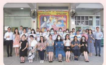
▲ 香港校際朗誦節得獎同學合照