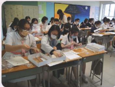
手作立體燈畫工作坊