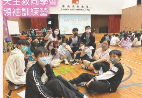
天主教同學會 領袖訓練營