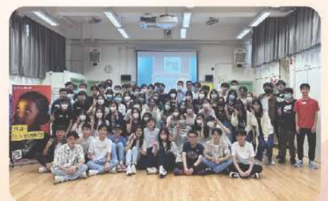
▲ 同學們舉行了名為「盲旅」的聯校籌款活動，為奧比斯籌款