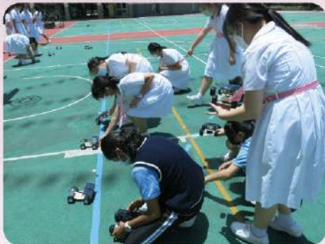
太陽能車運作測試