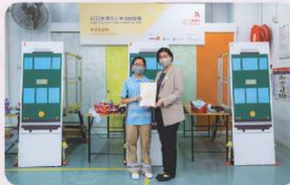
▲ 油漆及裝飾比賽高中組季軍