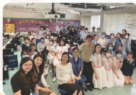
與母會扶輪社交流