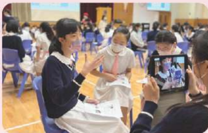
▲ 中三同學在外籍老師舉辦的工作坊, 模擬自己是科學家接受訪問