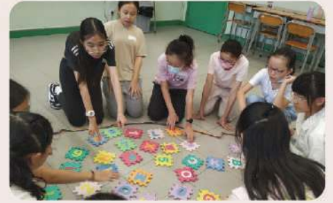
▲ 群策群力解開難題