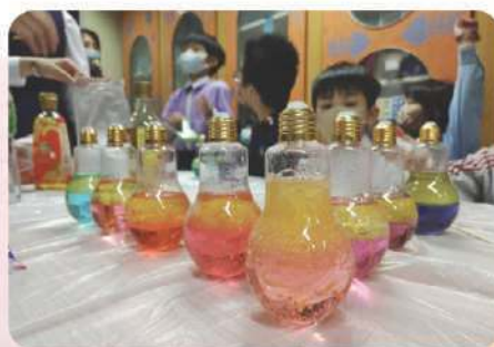
社會服務 — 教導小學生做科學實驗