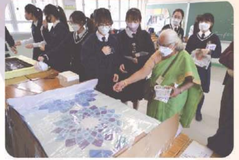
來賓積極參與遊戲