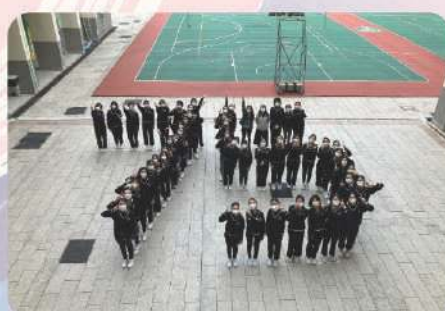
75週年校慶領袖生合影