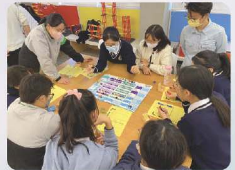
參與「生涯財智策劃家」工作坊