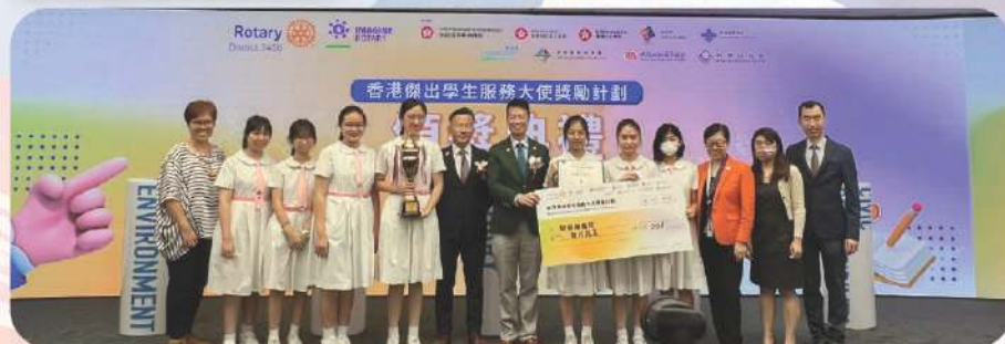
2022-23 香港傑出學生服務大使 — 銅獎