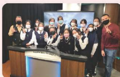
▲ 同學參觀南華早報工作室, 學習做主播