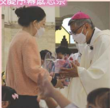
七十五周年 校慶序幕感恩祭