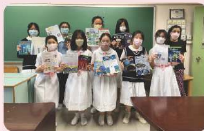
▲ 中二同學閱讀與STEM有關的英文書後, 製作海報展示閱後心得