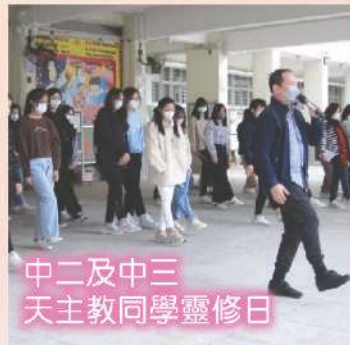
中二及中三 天主教同學靈修日