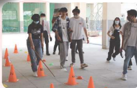
▲ 同學們參加「盲旅」體驗活動，了解失明人士平日的生活