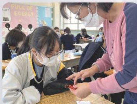
認識非物質文化遺產—中國結