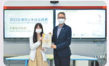
▲ 平面設計科技比賽高中組亞軍