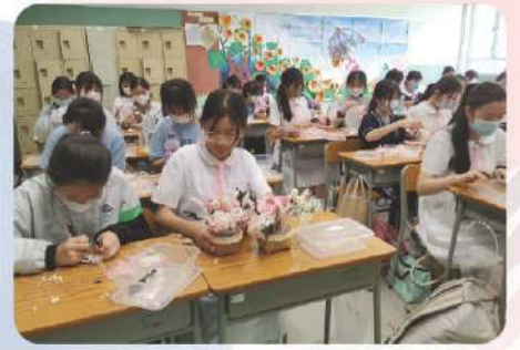
母親節花籃製作工作坊