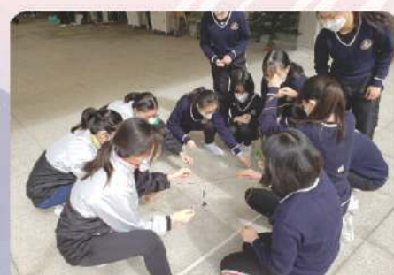
有趣的領袖生訓練日活動